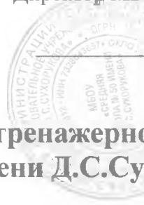
График работы спортивного и тренажерного залов МБОУ «Средняя школа № 50 имени Д.С.Сухорукова»